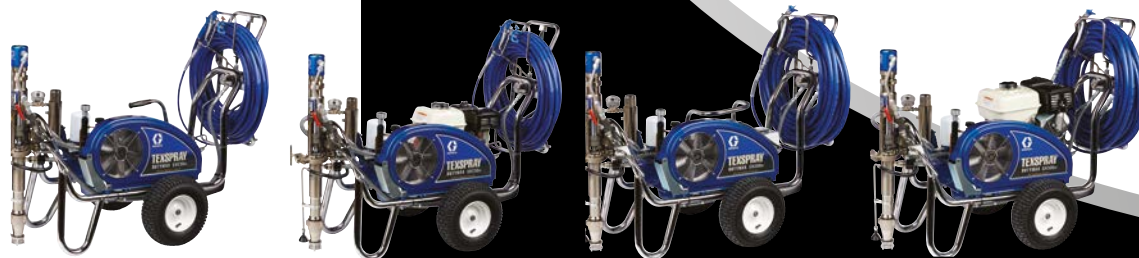
DUTYMAX™ EH230DI PROCONTRACTOR DUTYMAX™ GH230DI PROCONTRACTOR DUTYMAX™ EH300DI PROCONTRACTOR DUTYMAX™ GH300DI PROCONTRACTOR